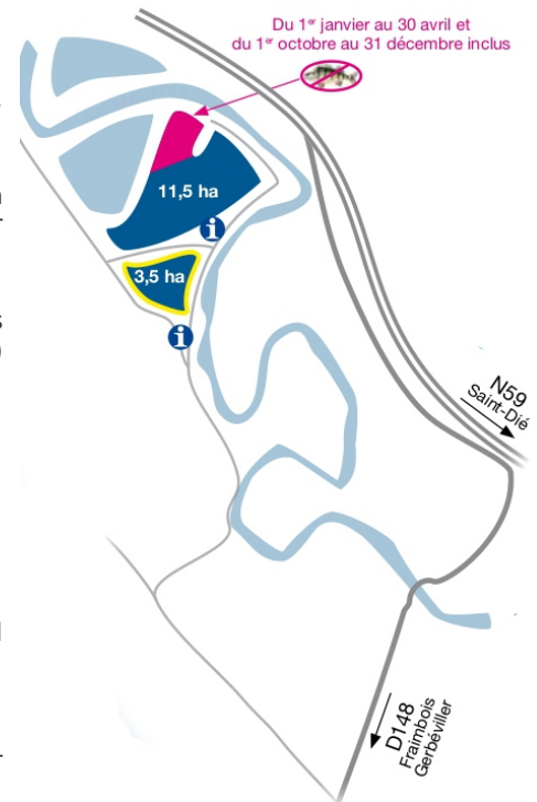
1.) Étangs fédéraux René BOURY

Am Pétit Étang (1,5 ha) gilt No-Kill, d.h. alle gefangenen Fische müssen unverzüglich, ohne Kennzeichnung ins Wasser zurückgesetzt werden. Daher ist das Fischen mit Köderfischen (tot oder lebendig) verboten.